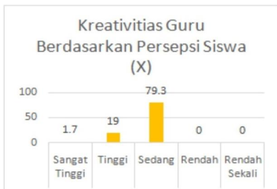
Gambar 2: Histogram Distribusi Frekuensi kreativitas guru berdasarkan persepsi siswa

Jawaban responden bahwa kreativitas guru berdasarkan persepsi siswa sedang yaitu 46 orang (79,3%), kategori tinggi sebanyak 11 orang (19%) dan kategori sangat tinggi sebanyak 1 orang (1,7%) dan tidak ada kategori rendah dan rendah sekali.